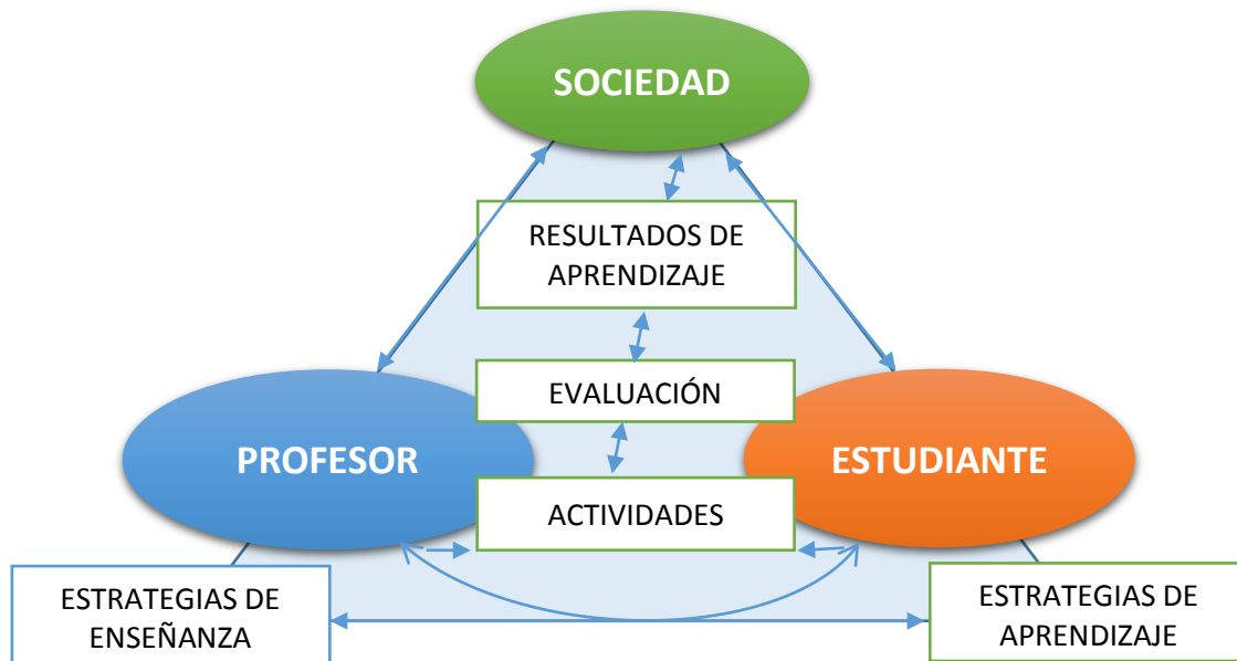
Figura 2. Modelo pedagógico